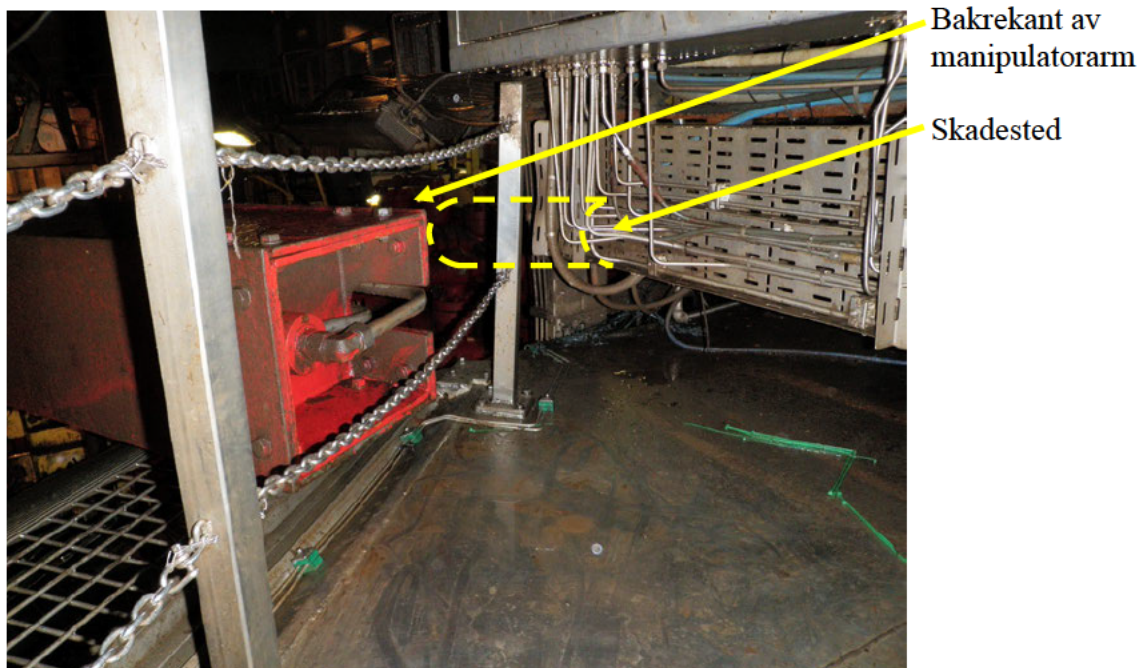
Figur 3 skadested