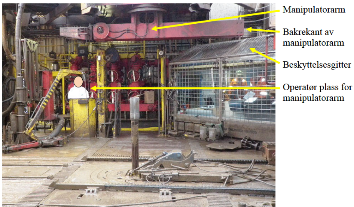
Figur 1 boredekk og LRA (manipulatorarm)