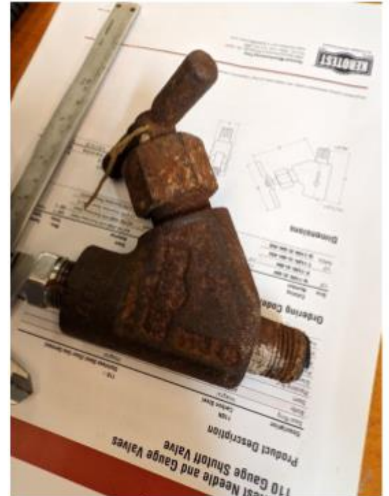
Figur 1 Kerotest nåleventil