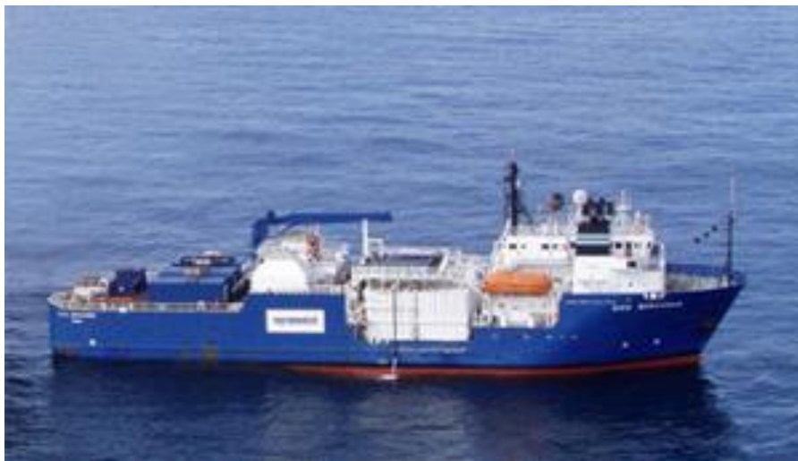
Bilde 2: Big Orange XVIII

Big Orange XVIII ble bygd i 1984 og er spesielt utrustet for brønnstimulering. Fartøyet er registrert (flaggstat) i Nassau, Bahamas. DNV har klasset fartøyet. Fartøyet er 243 fot langt og 59 fot bredt. Dødvekten er om lag 3700 tonn.