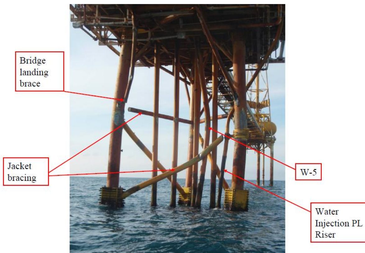
Bilde 3: Skader på Ekofisk 2/4-Ws bærende konstruksjon, konduktor og stigerør