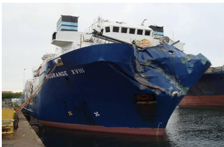
Bilde 4: Skader på Big Orange XVIII